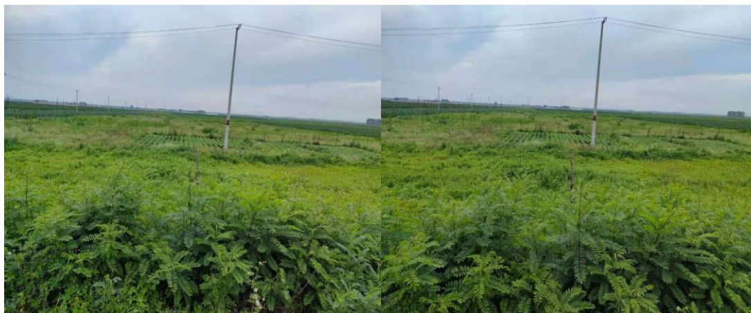
图 2-1 工程现状图

建设工期：项目计划于 2021 年 8 月开工建设，2022 年 8 月建设完成，总工期为 13 个月。工程建设区现状见图 2-1。